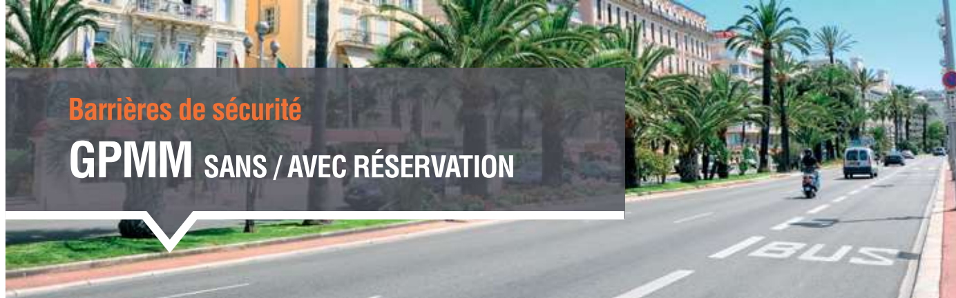
GPMM sans réservation